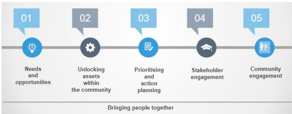
Kuva 1. Työpajojen aikana käsitellyt teemoja.

Syksyllä 2019 yhteensä 64 maaseutuyhteisön edustajaa Virosta, Suomesta, Skotlannista ja Romaniasta osallistui työpajoihin, joissa keskityttiin hankkeen ensimmäisen teeman "Yhteisön aktivointi ja osallistumisen menetelmät maaseutualueilla" opintomateriaalin sisällön tarkasteluun. Yhteisöihin ja osallistumiseen liittyvä materiaali on jaettu viiteen alateemaan (kuva 1), joista jokainen pyrkii osaltaan tukemaan yhteisölähtöisten yhteiskunnallisten yritysten kehittämistä maaseudulla.