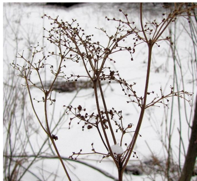
Älggräset kan lätt kännas igen även på vintern på den yviga trattlika blomställningen.

Vinterståndare är örtartade växter vars stjälk har vissnat, torkat och blir kvar upprättstående under vintern. Många vinterståndare fäller sina frön på snö och is och dessa kan spridas långa sträckor med vinden till nya växtplatser.