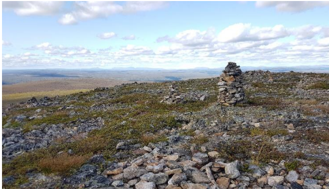
Kartt 2. Aarktla vuu'd luätt lij ráâ'sš muttöözziid da tön määngnallašvuö'tt occan jeärböššân äimmösmuttâz seu'rrijöšân. Kartt Karigasnjaarg Ailigast.

Ceälaita'rkstööllmööžžast da mäddâânnmöšše kolljeei konfliikti rä'tk'kummšest älgg vä'ldded lokku pirrös- da täällösvuei'nmemku'imi läâ'zzen pištivuöđ sosiaalla da kulttuurla vuällamvuöđ. Tät kuöskkäd jeärböššân mäddââ'nmem vue'jest, ko'st jee'res sektoo'rest lij haal läâ'zzted täimm'möözžeez vuu'dest. Kuâivâsindustria, biotäällös-, mä'tk'keemsue'rğğ- da luättjie'llemvue'ji täimmje täujja seämma vuu'din. Ouddmiärkkân kuâivâsindustria vaikkat vuöi'ğgest da kie'rddjeen jee'res sektoorid. Seämma ääi'j aarktla vuu'd mä'tk'keemsue'rji oudâsviikkmöš lij jönn vuei'tlvažvuö'tt, leša še mä'tk'keemsue'rjest liä määngnallšem vaikktoözz nuu'bbid sektoorid. Risttreeidai rä'tk'kummuš da jee'res äâ'nmemnaa'li ö'httesuâvtööllmöš nu'tt, što luättjie'llemvue'ji täimm'möš lij seämma äi'ğgsânji staanum vuäitt lee'd vä'žžlôs. Tän mäâi'nest lij vuössârvvsa vääžnai pörggâd vuässätted jee'res toi'mmjee'jid vuârnsagstööllmöšše da oudâsviikkäd kulttuursensitiivlaid täimmjemnaa'lin. 2