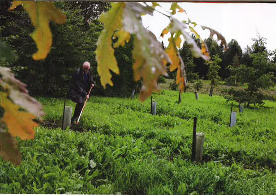
Matti Pylkkänen polstaa rikkaruohot tryffeliviljelmän puiden juurialueilta.