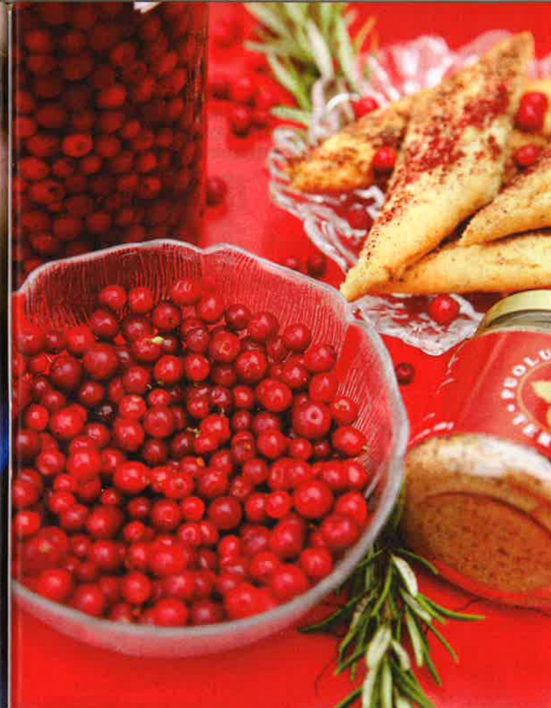
Puolukka on Tertissä monipuolisesti käytössä. Talveksi sitä säilötään muun muassa perinteisesti vesipuolukkana.