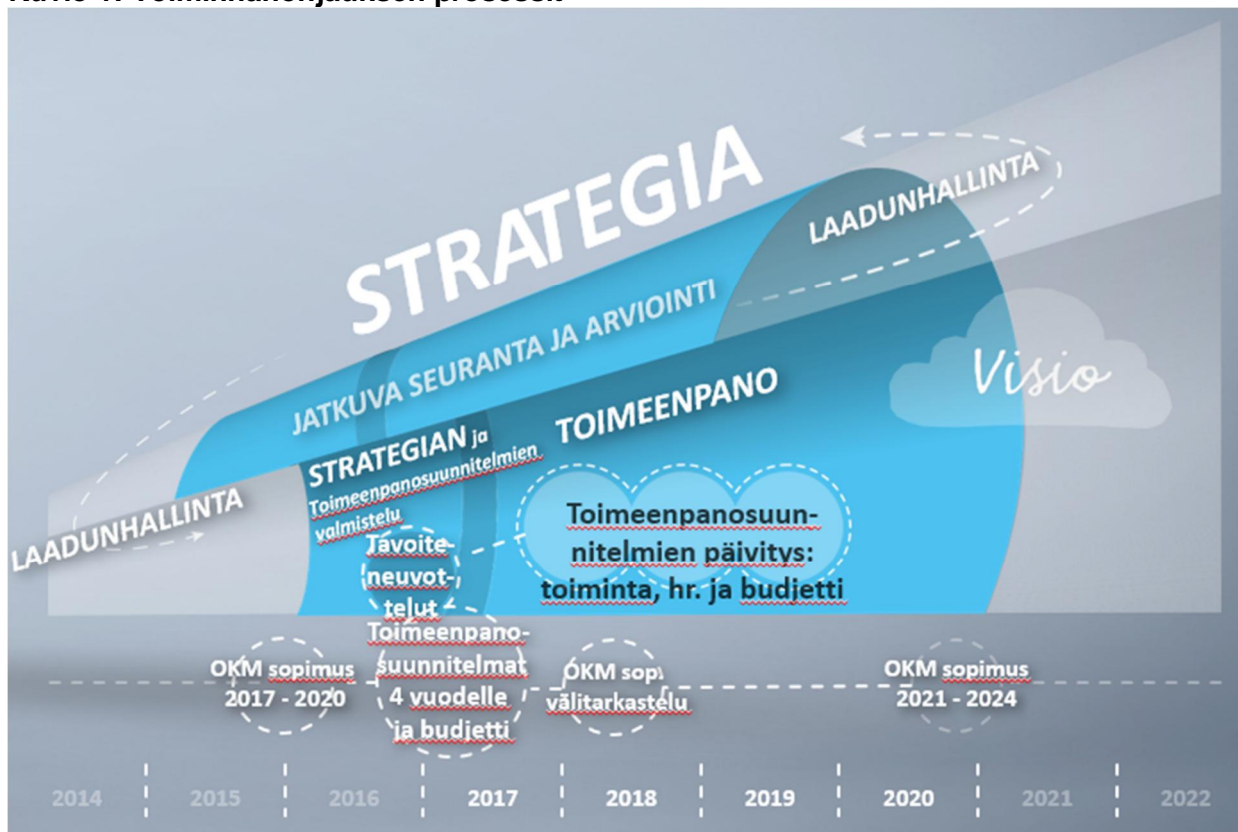
Kuvio 1: Toiminnanohjauksen prosessit

Yliopisto seuraa strategian toteutumista vuosittain osana toiminnanohjausprosessia.